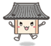
創立100周年タイトル